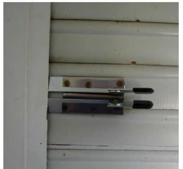
Einbruchsicherung für Rolläden