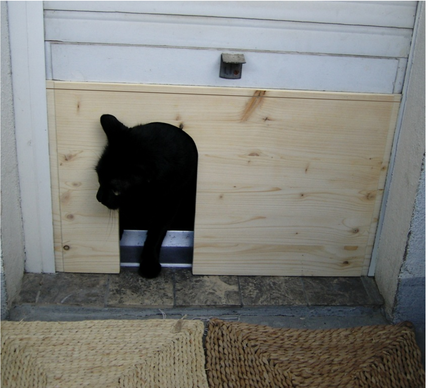
Katzentür noch unbehandelt